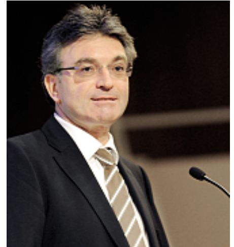
Bittet die Regierung im Umgang mit Roma-Flüchtlingen um Hilfe: Freiburgs Oberbürgermeister Dieter Salomon.

illegale Flüchtlinge eher zu dulden, anzuerkennen und zu integrieren, als abzuschieben. Allein zwischen 2009 und 2011 kamen 270 Roma-Flüchtlinge nach Freiburg, was die Stadt zusätzlich um etwa drei Millionen Euro pro Jahr belastet. In einem Brief an Ministerpräsident Winfried Kretschmann (Grüne) bat Salomon deshalb um Nothilfe. Die Aufnahme und Unterbringung von Flüchtlingen sei eine Aufgabe, die sich dem Land, den Kommunen und den Landkreisen gemeinsam stelle. Für die Gruppe der Asylsuchenden verwies Salomon in seinem Schreiben auf ein bundesweit bewährtes Verfahren, das im Asylverfahrensgesetz (Paragraf 45 AsylVfG) normiert sei und Aufnahmequoten für Länder, Kommunen und Kreise vorsehe, worüber eine gleichmäßige Verteilung sichergestellt werden könnte. red